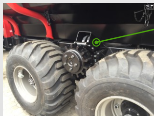
vlastní hydraulický okruh s ideálním průtokem a tlakem od 1000 ot./min. na motoru