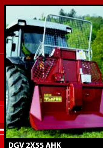
DGV 2X55 AHK